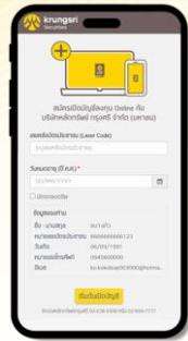
กรอกข้อมูลเบื้องต้น จากนั้นคลิก "ดำเนินการต่อ"