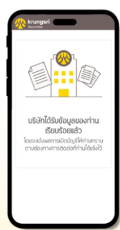
สมัครสำเร็จ และ รอผลอนุมัติ