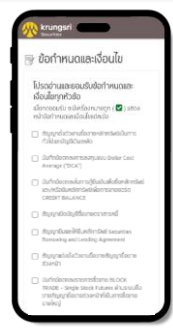
อ่านและยอมรับสัญญา ข้อกำหนด & เงื่อนไขทุกหัวข้อ