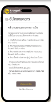
อัปโหลดหลักฐานทางการเงิน