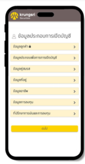
กรอกข้อมูลส่วนบุคคล ร-ผู้ดูแลบัญชี (FA)