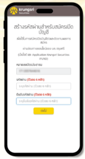
ตั้งรหัสผ่านเพื่อติดตามผล / สมัครต่อ