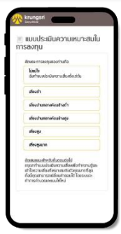
ทำแบบประเมิน Suitability Test