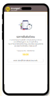
ยืนยันตัวตนภายใน 60 นาที