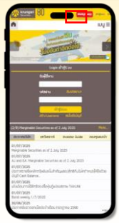
เข้าหน้าเว็บไซต์ krungrisecurities.com และคลิกเมนูเปิด "บัญชีลงทุน"