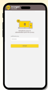
กรอกเลขบัตรประชาชน จากนั้นคลิก "เปิดบัญชี"