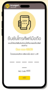
ระบุรหัส SMS OTP เพื่อยืนยันเบอร์มือถือ