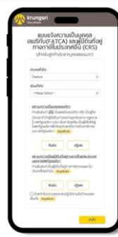
กรอกแบบฟอร์ม FATCA / CRS