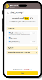
เลือกประเภทบัญชี