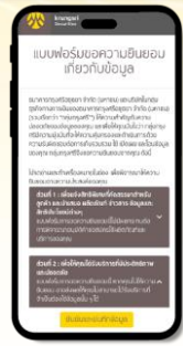
แบบฟอร์มขอความยินยอมเกี่ยวกับข้อมูล