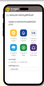
สมัครบริการหักบัญชีอัตโนมัติ (ATS)