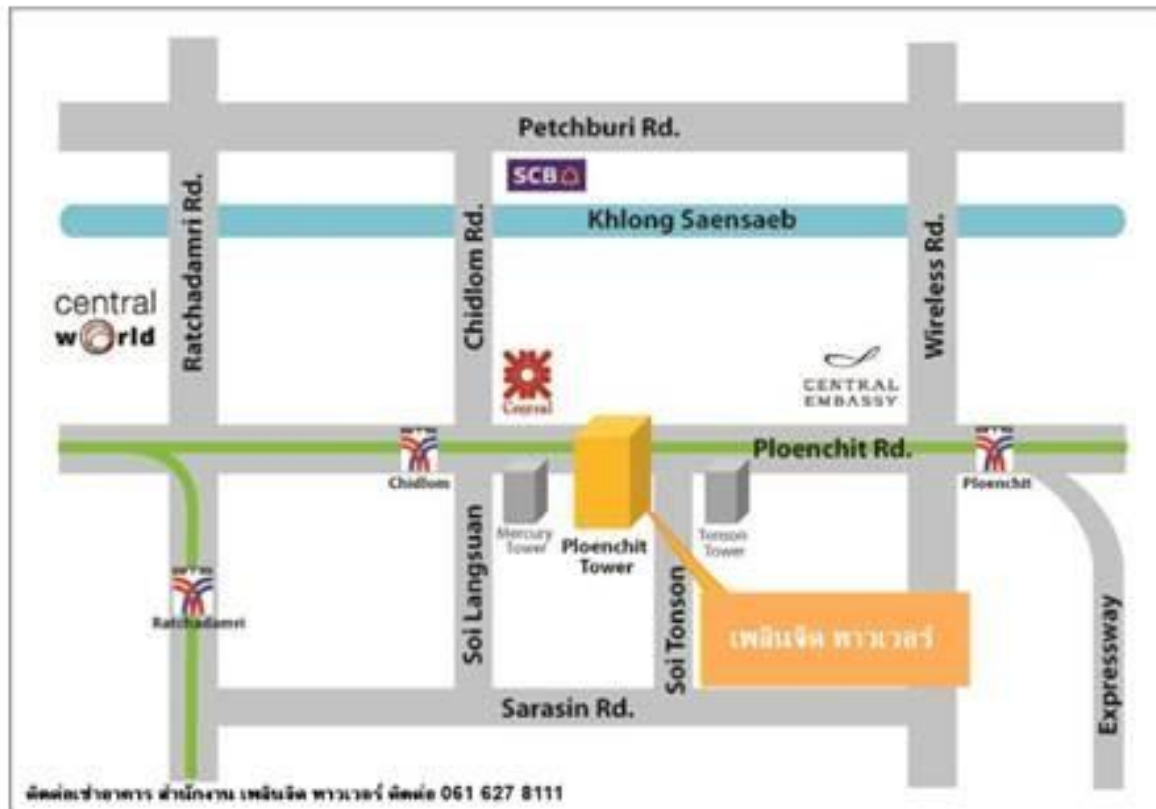
Map of Ploenchit Tower (KSS)

ณ ห้องประชุม สำนักงานใหญ่ของบริษัท ชั้น 3 อาคารเพลินจิตทาวเวอร์ เลขที่ 898 ถนนเพลินจิต แขวงลุมพินี เขตปทุมวัน กรุงเทพมหานคร 10330